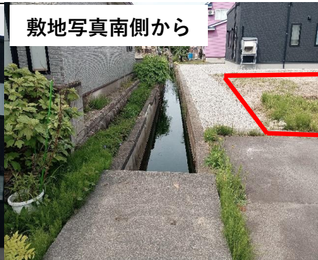
敷地写真南側から