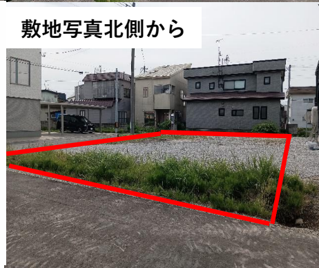
敷地写真北側から