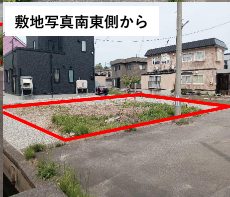
敷地写真南東側から